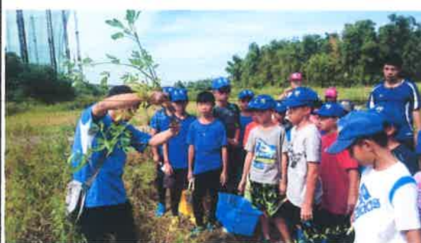
說明：收成前老師指導學生們採收之要領