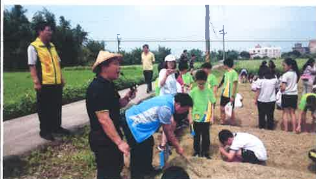
說明：全體畢業生在各班導師帶領下來到食農教育花生田