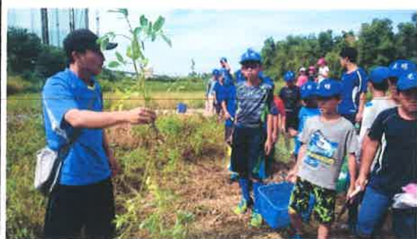
說明：學生們種植花植的過程