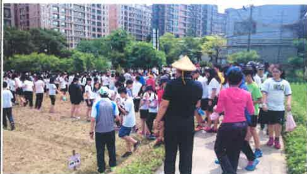
說明：104學年度應屆畢業生進行「拼了！好事會花生」食農教育體驗活動